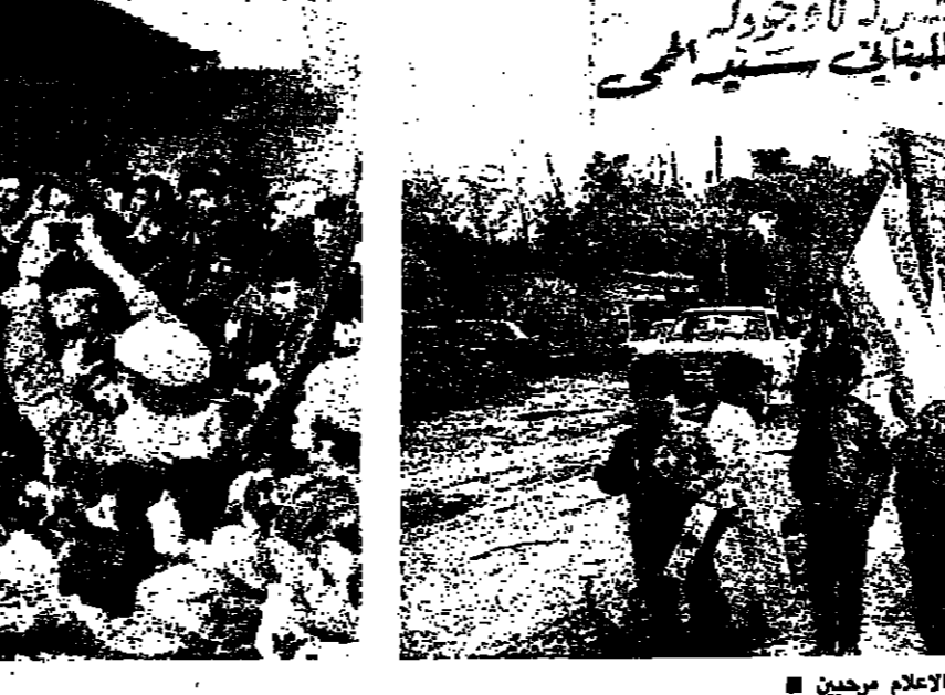
الاطفال يحملون الاعلام مرحيين